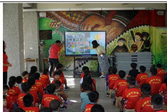
外聘講師於週會時間做交通安全案例分享