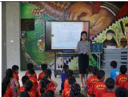
校長於開學典禮做交通安全宣導