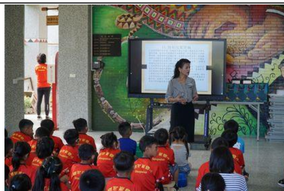
學務組長於週會做交通安全宣導