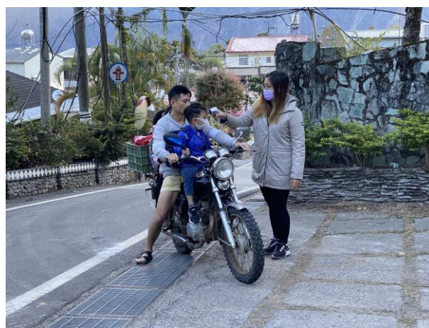
導護老師協同轄區派出所員警於校門口執行學童上放學安全指導