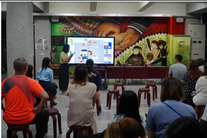
於家長座談會時，宣導本校學生接送區域注意事項