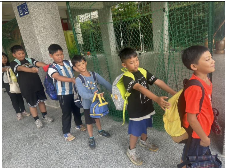
學生依照各隊路線排列離開